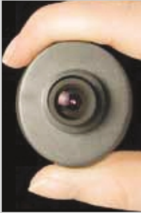
Mini KAMERA: X-10 kameraları evdeki her odayı kontrol altında tutuyor.

raz önce şofbeninizi çalıştırması için ayarlayabiliyorsunuz. Ya da çok önemli bilgilerinizi ve değerli eşyalarınızı tuttuğunuz odanıza biri girdiğinde, hem odadaki kameraların kayıt tutmasını, hem de nerede olursanız olun, bilgisayarın sizi haberdar etmesini sağlayabiliyorsunuz.