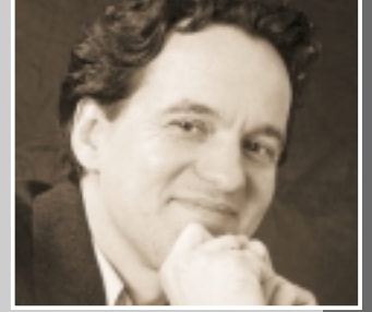
MIKE SANDBOTHE (40), Medya Filozofu

İnsanlık tarihinin en ilginç yüzyılının başındayız. Peki ama yarının dünyası nasıl olacak? CHIP size her ay bilişim çağının öncü düşünürlerini vizyonları ve ütopyalarıyla tanıtıyor.