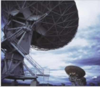
YER İSTASYONLARI: Echelon için yer istasyonları hayati önem taşıyor.

Birkaç ay önce İtalya'da yapılan gelişmiş ülkeler zirvesinde de, Amerikan istihbaratının, Echelon sisteminin kulaklarını İtalya'ya çevirmesini istediğini tüm gazeteler yazmıştı. Bu deliller ışığında, Echelon'un tüm dünyayı değil, sadece is-