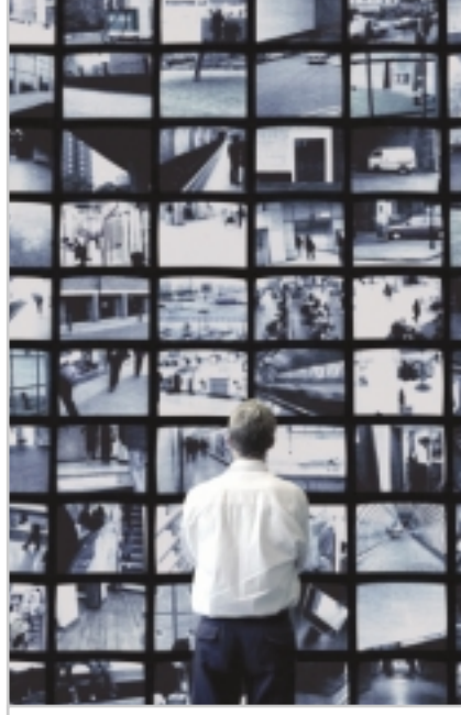
BIG BROTHER: Her şeyi izleyen, gören, bilen "Big Brother" teorisi Echelon söylentilerinin kaynağını oluşturuyor.

tenilen küçük bir hedef bölgeyi izleyebilecek kapasitesi olduğu ispatlanıyordu. Ancak bu bile Avrupalıları, Japonları çıldırtmaya yetiyordu. Çünkü önemli bir ihale öncesinde veya gizli bir araştırma aşamasında, belli bir hedefe yöneltilen bu süper hassas kulaklarla, Avrupalı, Japon veya uzak doğulu bir firmanın tüm teknolojik ve mali sırları Amerika'luların eline geçebilirdi ki, bizzat başkan tarafından Amerika'nın ticari başarısını sağlamakla görevlendirilen CIA'nın yabancı şirketlerin bu sırlarını Amerika'daki rakiplerine vermeyeceğini düşünmek de saflık olurdu. Sonuçta Avrupalılar endişelerini gizleyemediler ve resmi olarak yayınlanan raporda tüm Avrupalı şirketlere, bü-